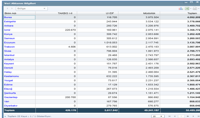
Şekil 2: MEGSİS_İstatistik_Bilgileri_02

Bu modül ile verilerin aktarım bilgileri bölge ve il bazında istatistik olarak sunulmaktadır. Ayrıca listelenen kayıtlar veya seçilen tapu mahallesi/köye ait tüm kayıtlar .xls veya .csv formatından raporlanabilir.