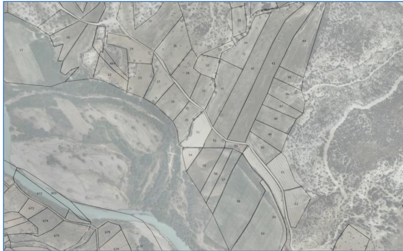
Şekil 4: MEGSIS_Ortofoto_Sunumu_04

Sistemde tutulan kadaströ bilgileri ile uyumlu bir şekilde ortofoto haritaları kullanıcılara sunulmaktadır.