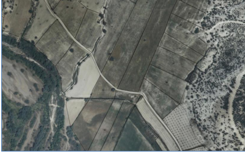
Şekil 5: MEGSIS_Ortofoto_Sunumu_05

Kullanıcı tarafından saydamlık ayarlaması yapılarak görüntüleme yapılabilmektedir.