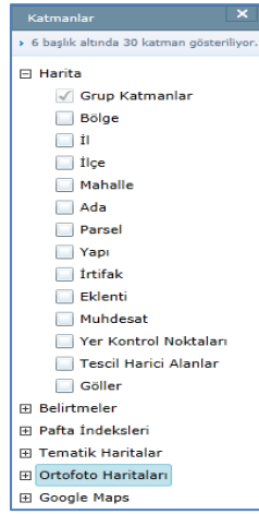
Şekil 1: MEGSIS_Ortofoto_Sunumu_01

Kullanıcılar tarafından harita ekranı üzerinde sağ tarafta yer alan katmanlar içerisinde yer alan ortofoto haritaları başlığı altından sisteme aktarılıp, tile edilen ortofoto haritalarının görüntülenebilir.